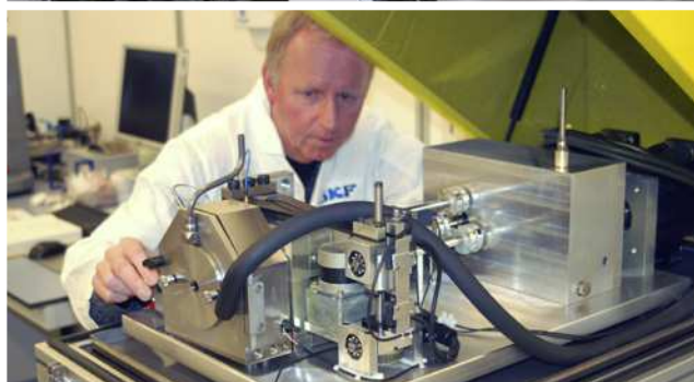
Научно-исследовательский центр SKF в Нидерландах