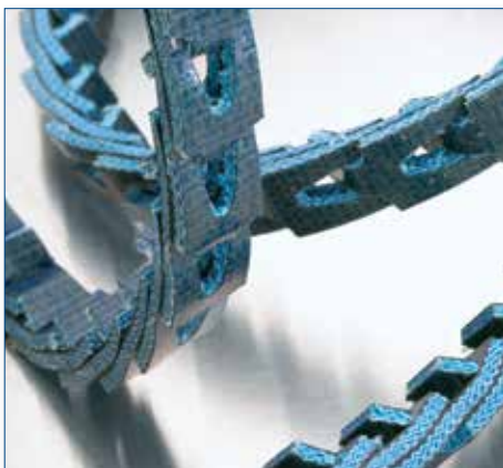
номер патента: 7,621,114

Сталкиваетесь с проблемой накопления электростатического заряда в оборудовании?