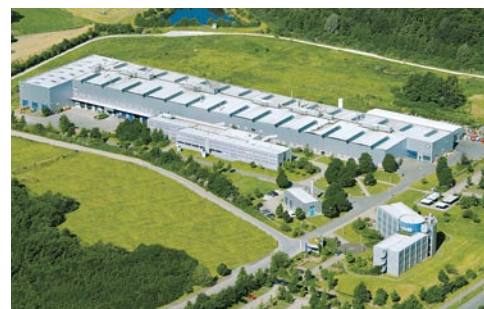
Завод ELGES в городе Штайнхаген: благодаря 60-летнему опыту в сфере изготовления подшипников скольжения и использованию самой современной технологии каждый подшипник представляет собой продукт высочайшего качества

ELGES и Permaglide® – продукты для самого широкого спектра применений. Вы не сможете желать лучшего! Мы надеемся на интенсивный диалог и сотрудничество с Вами.