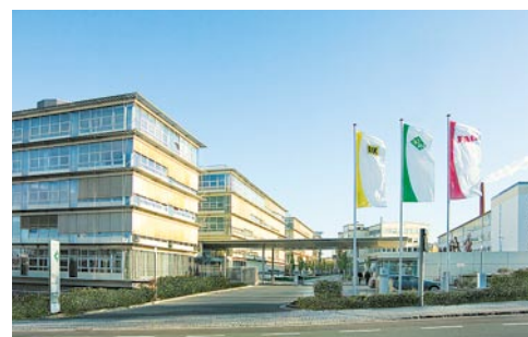
Штаб-квартира Schaeffler Group в г. Херцогенаурах: именно здесь происходит координация действий отделов продаж и инженерных служб по применению продукции Schaeffler Group во всём мире