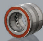
Блок ступицы 41.19305