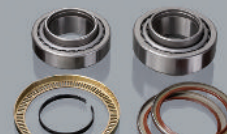
Блок ступицы 41.05628